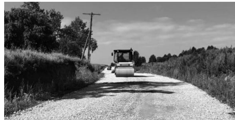
Строительство дороги в с. Чубаровском.

Наши сельхозпредприятия развиваются и модернизируют свое производство. Наша цель с руководителями сельхозпредприятий